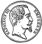
Expos. Besançon 1860