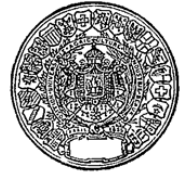
Expos. Nantes 1861