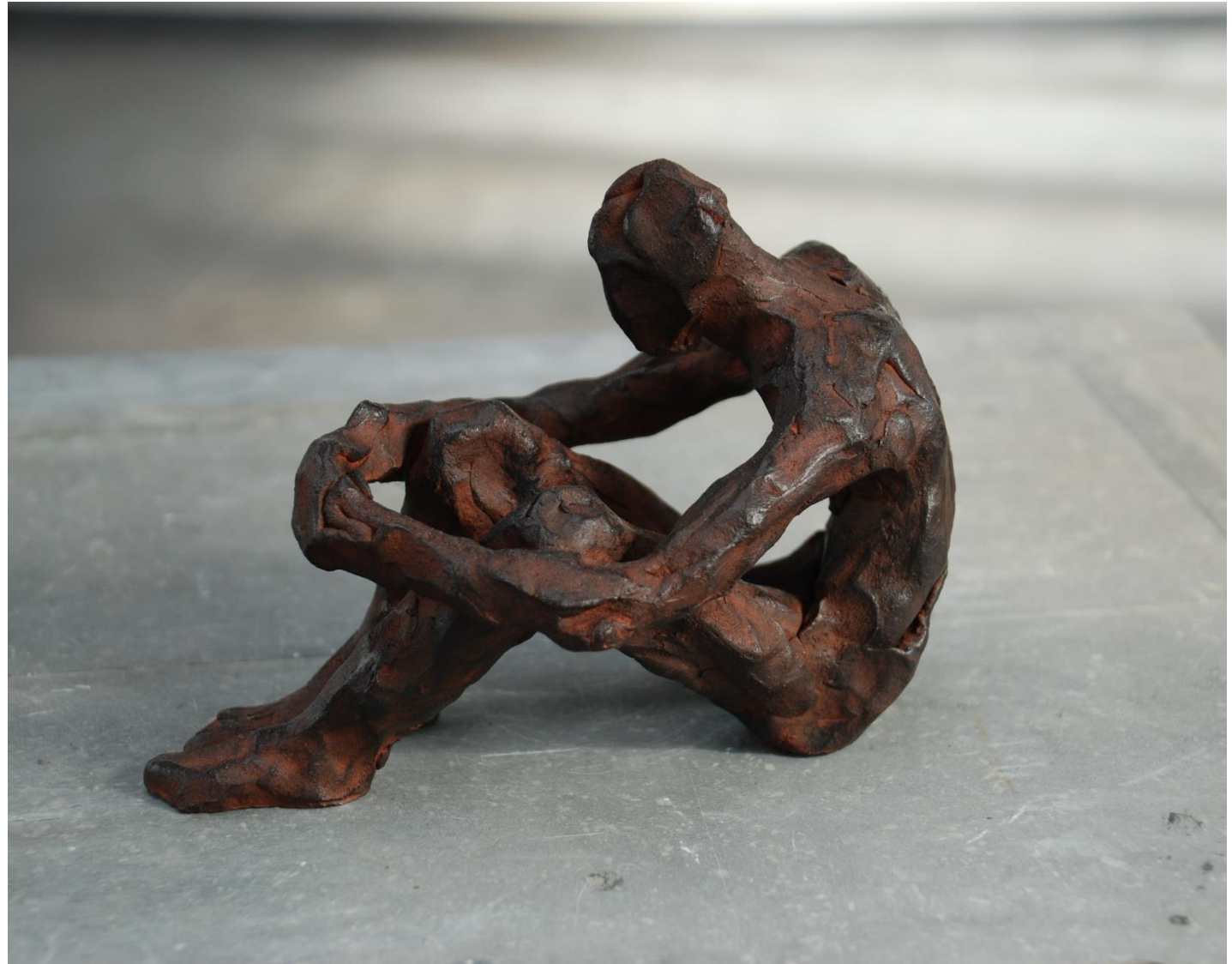
Sculpture: M. Glandorf

Anne Veghter: Ondertussen in Nederland III (trad. libre)