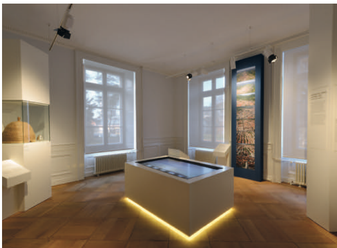
La Chaux-de-Fonds, Musée d'histoire, salle 1.

Dans le cadre de ce projet muséal, il est prévu de développer une réflexion sur le rôle et la fonction d'un musée d'histoire au 21 e siècle. Après une analyse complète de l'exposition permanente présentée actuellement au Musée d'histoire, le premier semestre sera consacré à développer une analyse critique du musée d'histoire, plus spécifiquement du musée d'histoire urbaine, avec l'objectif de repérer les bonnes et les moins bonnes pratiques muséographiques. Le deuxième semestre, développé en étroite collaboration avec l'Institut d'histoire, portera sur les thématiques à approfondir, qu'il s'agira d'identifier et de circonscrire, et sur le choix des objets, documents et dispositifs à retenir. Une fois ces tâches accomplies, le projet muséal s'orientera sur des aspects scénographiques : identifier les mises en espace les plus pertinentes pour traiter les différents thèmes retenus. Le projet muséal est prévu pour se poursuivre l'année suivante : le semestre 3, proprement scénographique, sera entièrement consacré à l'écriture du projet de nouvelle exposition permanente ; le semestre 4 sera consacré à l'accompagnement du montage de l'exposition prévue.