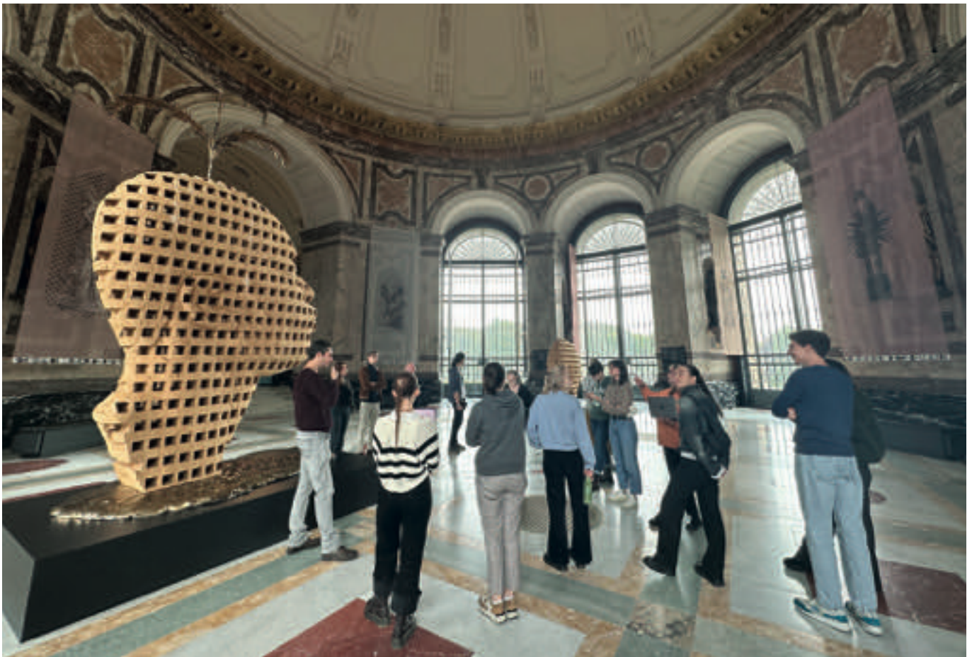
Les étudiant-e-s de la promotion 2022/2023 du MAMS en visite à l'AFRICAM lors du Voyage d'étude à Bruxelles, mai 2023

N.B. : L'Institut d'histoire de l'art et de muséologie (IHAM) participe aux frais de logement sur place, ainsi qu'il finance ou négocie les entrées des institutions visitées. Une participation est toutefois demandée aux étudiant-e-s pour le transport de la Suisse à Hambourg. L'IHAM propose néanmoins une assistance pour une réservation groupée visant à garantir des prix abordables.