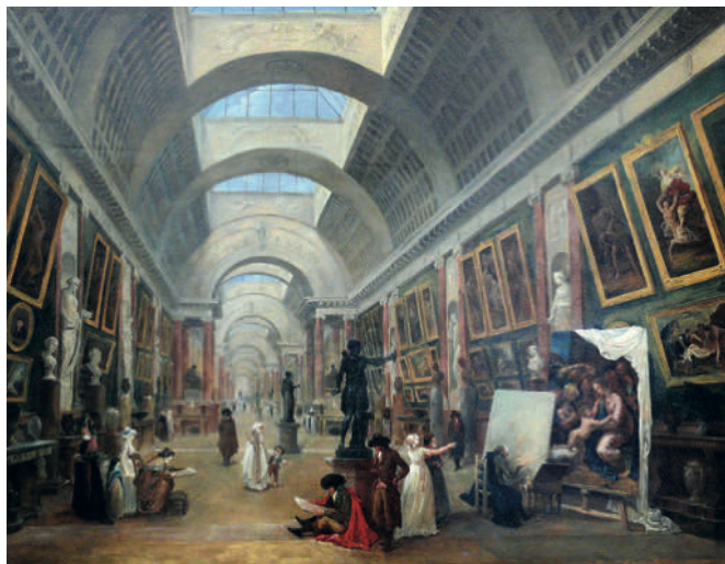
Hubert Robert, Projet d'aménagement de la Grande Galerie du Louvre , 1796, huile sur toile, 115 x 145 cm, Paris, Musée du Louvre [inv. RF 1975-10]

Le cours « Le musée actuel et ses fondements à l'époque moderne » propose une enquête sur l'émergence des institutions muséales en Europe. Ce parcours débutera à la Renaissance pour s'étendre ensuite au siècle des Lumières, période d'émulation durant laquelle de nombreuses collections privées s'ouvrent au public et trouvent une large diffusion par le biais de recueils ou de catalogues illustrés. Si la circulation des idées et des modèles muséologiques imprègne cette histoire, ces échanges seront par la suite souvent noyés dans l'homélie nationaliste qui entoure le rapide développement des musées au cours du 19 e siècle. Ces institutions, portées notamment par leurs architectes, directeurs, conservateurs et mécènes, deviennent alors les catalyseurs d'importants enjeux identitaires. À travers une série d'exemples choisis, ce cours visera à appréhender la genèse de nos musées actuels selon une double perspective : d'une part, comme des dépôts de notre passé et de notre culture et, d'autre part, comme témoins de notre rapport à l'histoire.