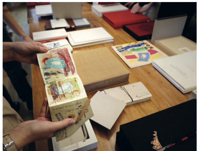
Étudiant-e-s préparant un projet d'exposition sur les livres d'artistes de la Bibliothèque publique et universitaire de Neuchâtel, novembre 2022