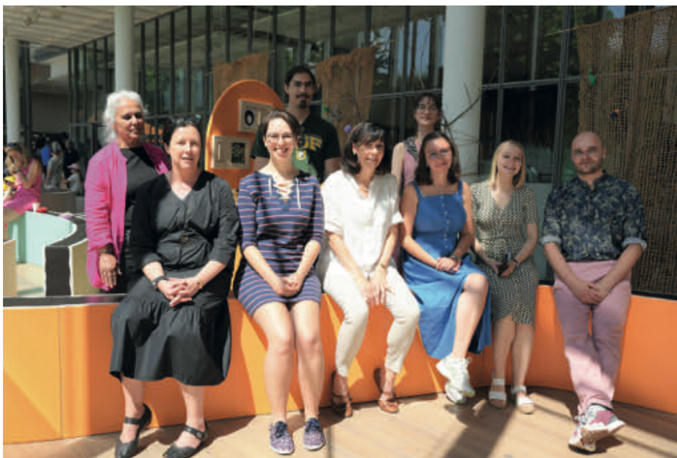
Étudiant-e-s inaugurant une exposition interactive sur Paul Klee et la nature au musée Creaviva, Zentrum Paul Klee, juin 2023