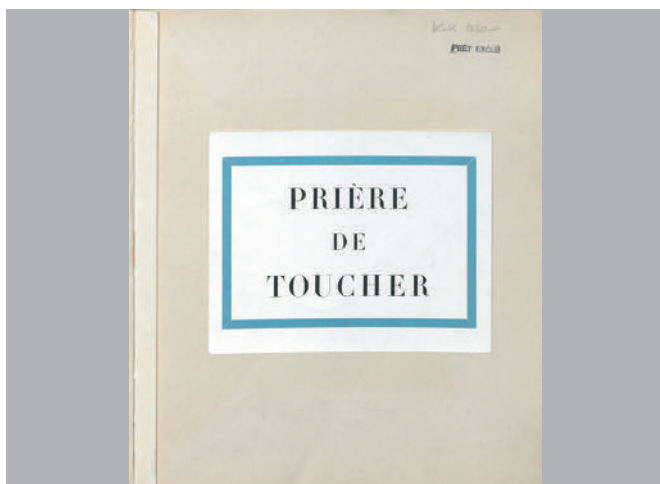
André Breton, Prière de toucher , livre, 1947 Musée d'art et d'histoire de Genève, Inv.n° BAA TB 1354

La collection d'arts graphiques du Musée d'art et d'histoire de Genève planifie pour l'été 2024 l'ouverture d'une exposition sur l'écriture automatique des surréalistes afin de commémorer le centenaire de la parution en 1924 du Manifeste surréaliste d'André Breton qui définit le surréalisme comme un « automatisme psychique pur par lequel on se propose d'exprimer, soit verbalement, soit par écrit, soit de toute autre manière, le fonctionnement réel de la pensée. Dictée de la pensée, en l'absence de tout contrôle exercé par la raison, en dehors de toute préoccupation esthétique ou morale. » L'exercice doit permettre aux étudiant·e·s de concevoir une exposition, de sa conception à sa commercialisation, en passant par la réalisation, la médiation et la communication.