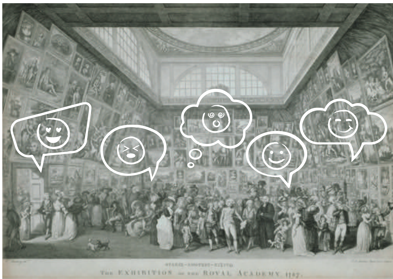
D'après Johann Heinrich Ramberg, The Exhibition of the Royal Academy 1787, 1787 , gravure au burin, 32,5 x 49,7 cm, Londres, Royal Academy of Arts.