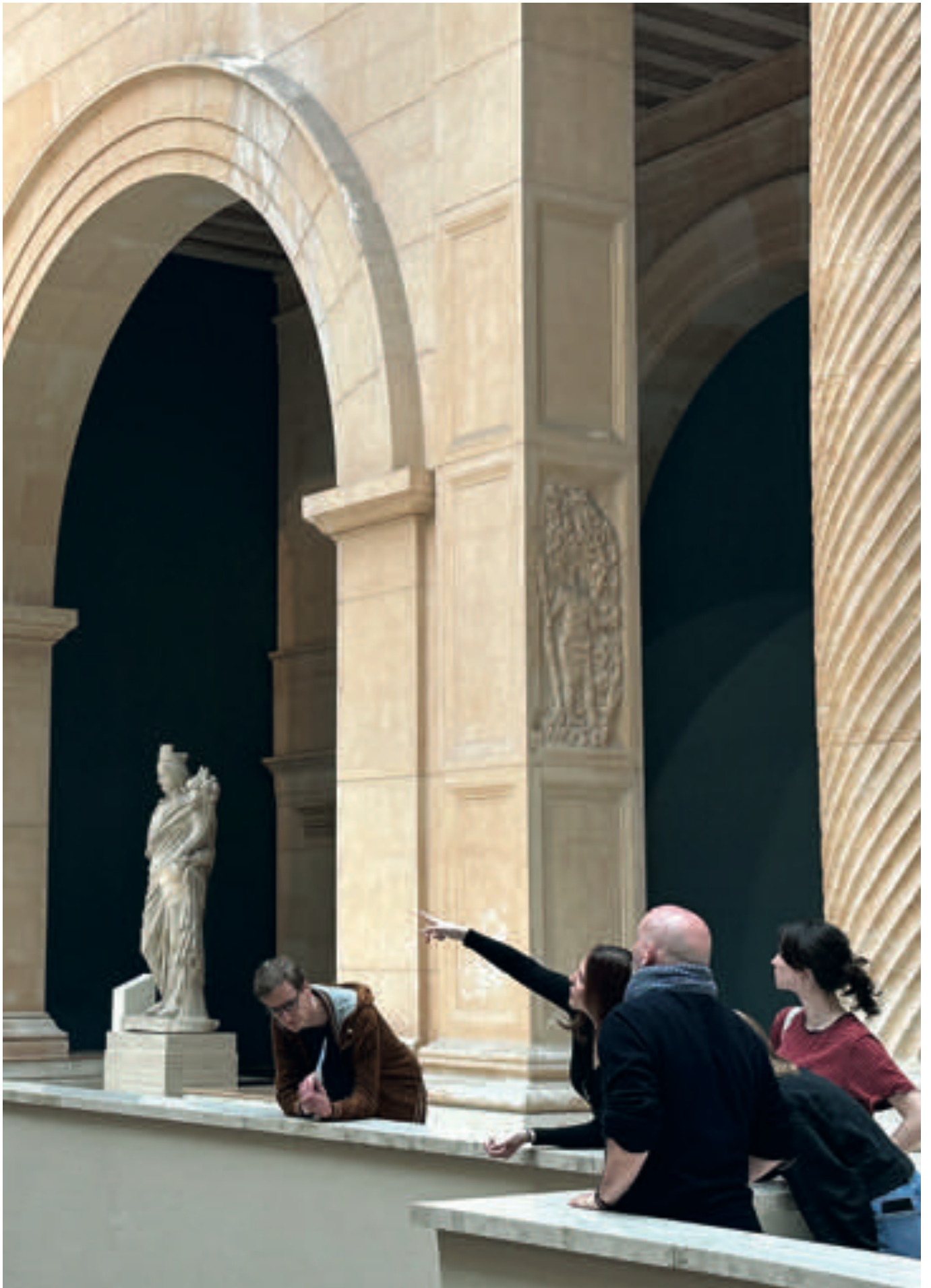
Voyage d'étude à Bruxelles, mai 2023