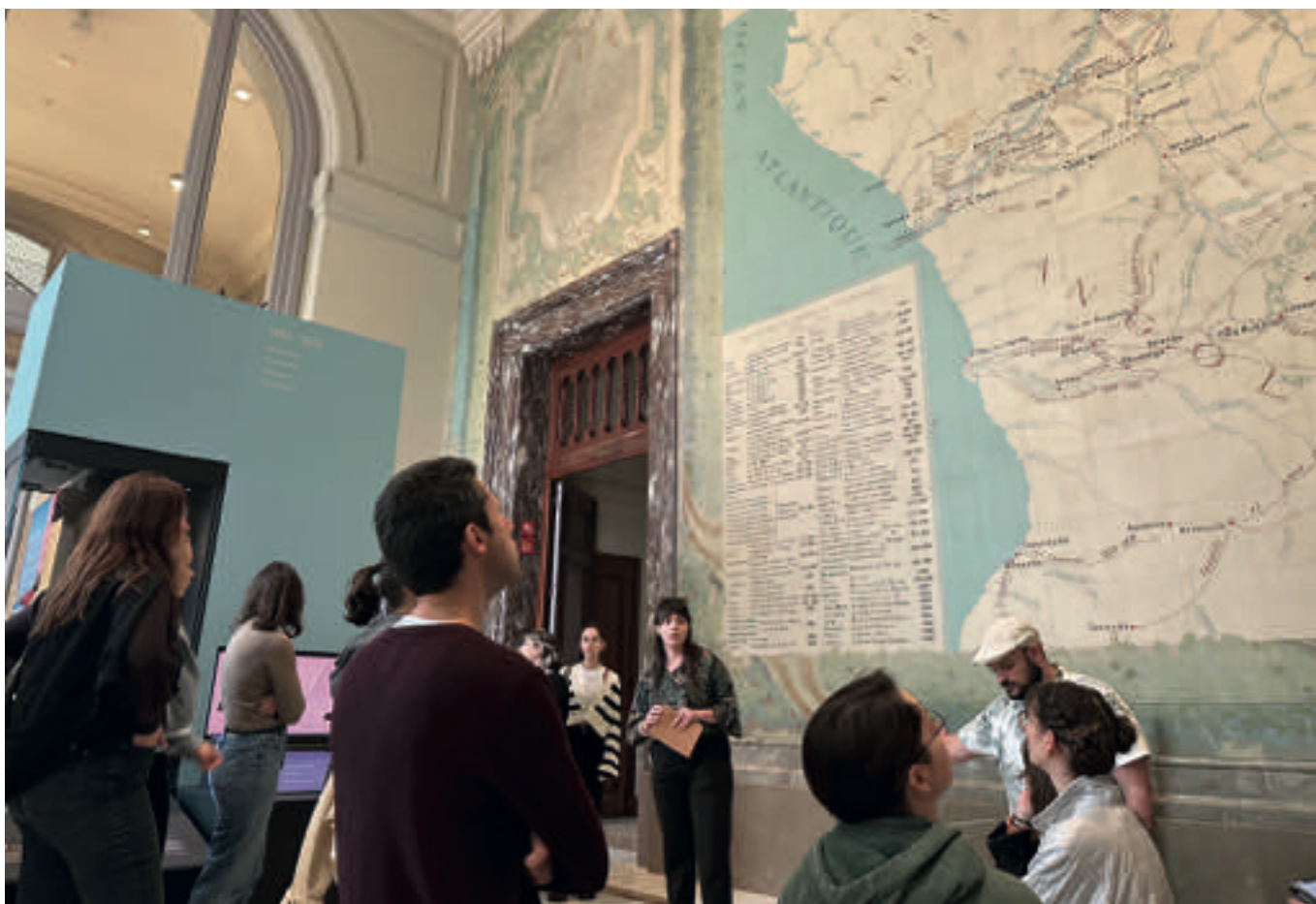
Les étudiant-e-s de la volée 2022/2023 du MAMS en visite à l'Africa Museum lors du Voyage d'étude à Bruxelles, mai 2023

Ce bloc comprend de plus une formation obligatoire de deux périodes au début de la première année d'études, dédiée à une introduction à la recherche documentaire. Cette formation permet de se familiariser avec les outils de recherche et les bases de données spécifiques à l'Université de Neuchâtel en vue de travaux pratiques et de la rédaction du mémoire de fin d'études. La date du cours – qui prend place généralement un lundi ou mardi et qui est dispensé par Monsieur Tristan Pun – est communiquée par la direction en début de semestre.