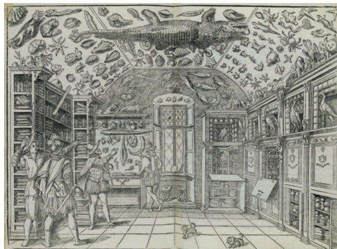
Ferrante Imperato, Dell'istoria naturale ... Libri XXVII... , 1599.

Toute réflexion sur la nature des musées, leur fonction, mais aussi leur valeur symptomatique d'une civilisation moderne, est jalonnée de textes. L'histoire de la muséologie, bien que relativement récente, s'exprime à travers de nombreux témoins qui renseignent l'étude du musée, son histoire et son rôle dans la société au cours du temps. Désormais, la discipline ouvre sur l'ensemble des réflexions théoriques liées au champ muséal. Comme le rappellent F. Mairesse et A. Desvallées, la muséologie s'intéresse en effet à « la relation spécifique entre l'homme et la réalité, [...] relation caractérisée comme la documentation du réel par l'appréhension sensible directe, ainsi que la thésaurisation et la présentation de cette expérience. » Dans ce séminaire, nous revenons sur quelques-uns des textes considérés comme essentiels, des Inscriptions de Samuel Quiccheberg (1565) à aujourd'hui, en cherchant à dégager les partis-pris théoriques qui les sous-tendent et en montrant en quoi leur lecture continue d'enrichir le discours réflexif contemporain.