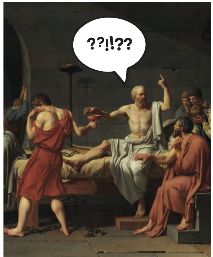
Jacques-Louis David, La Mort de Socrate , 1787, peinture à l'huile, New York, The Metropolitan Museum of Art.

La participation est en principe obligatoire. En cas d'empêchement d'ordre professionnel (par ex. congé refusé par l'employeur-euse) ou familial (par ex. enfant(s) à charge) ou de problèmes financiers, un programme alternatif en Suisse (par ex. visite de musée suivie d'un compte-rendu d'exposition) est proposé par la direction du Master en études muséales. En cas d'empêchement, l'étudiant-e doit prévenir les organisateurs-trices du voyage trois mois à l'avance. À noter que si le désistement au voyage est annoncé après le délai d'inscription au voyage et après le virement des frais de participation, le remboursement de ces derniers ne peut pas être assuré même en cas d'annulation pour problèmes de santé. Dans ce dernier cas, un certificat médical doit être présenté et l'étudiant-e doit en principe rattraper le voyage l'année suivante ou choisir l'alternative proposée.