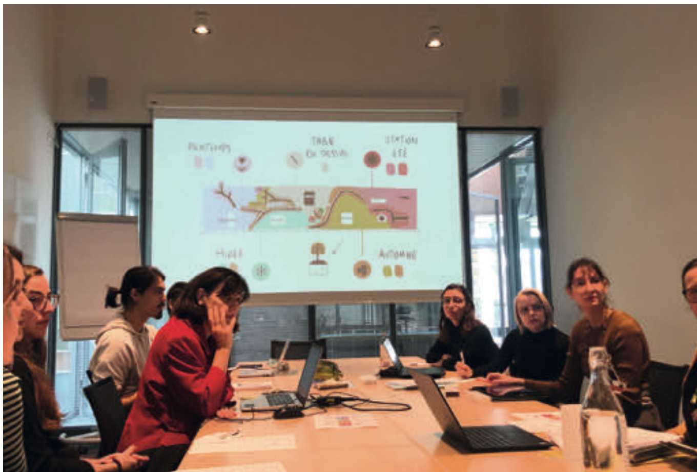
Étudiant-e-s préparant un projet d'exposition interactive sur Paul Klee et la nature pour le musée Creaviva, Zentrum Paul Klee, novembre 2022