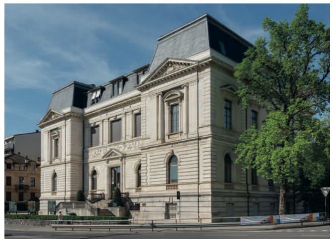
Vue extérieure du Musée Jenisch.

Ouvert en 1897 suite à un legs de Fanny Jenisch, veuve d'un sénateur hambourgeois, le Musée Jenisch Vevey était à l'origine conçu comme un musée encyclopédique réunissant sous son toit des collections d'art, d'histoire naturelle ainsi qu'une bibliothèque. Le présent projet muséal aura pour but d'éclairer les années de formation de cette institution en nous penchant sur l'histoire des premières œuvres ayant rejoint les collections du musée. Il s'agira de mener des recherches dans différentes archives institutionnelles pour tenter de retracer la provenance de ces pièces et leur contexte d'acquisition. Les résultats de ces recherches seront publiés sur le site du Musée Jenisch et présentés dans son parcours permanent sous forme d'encarts.