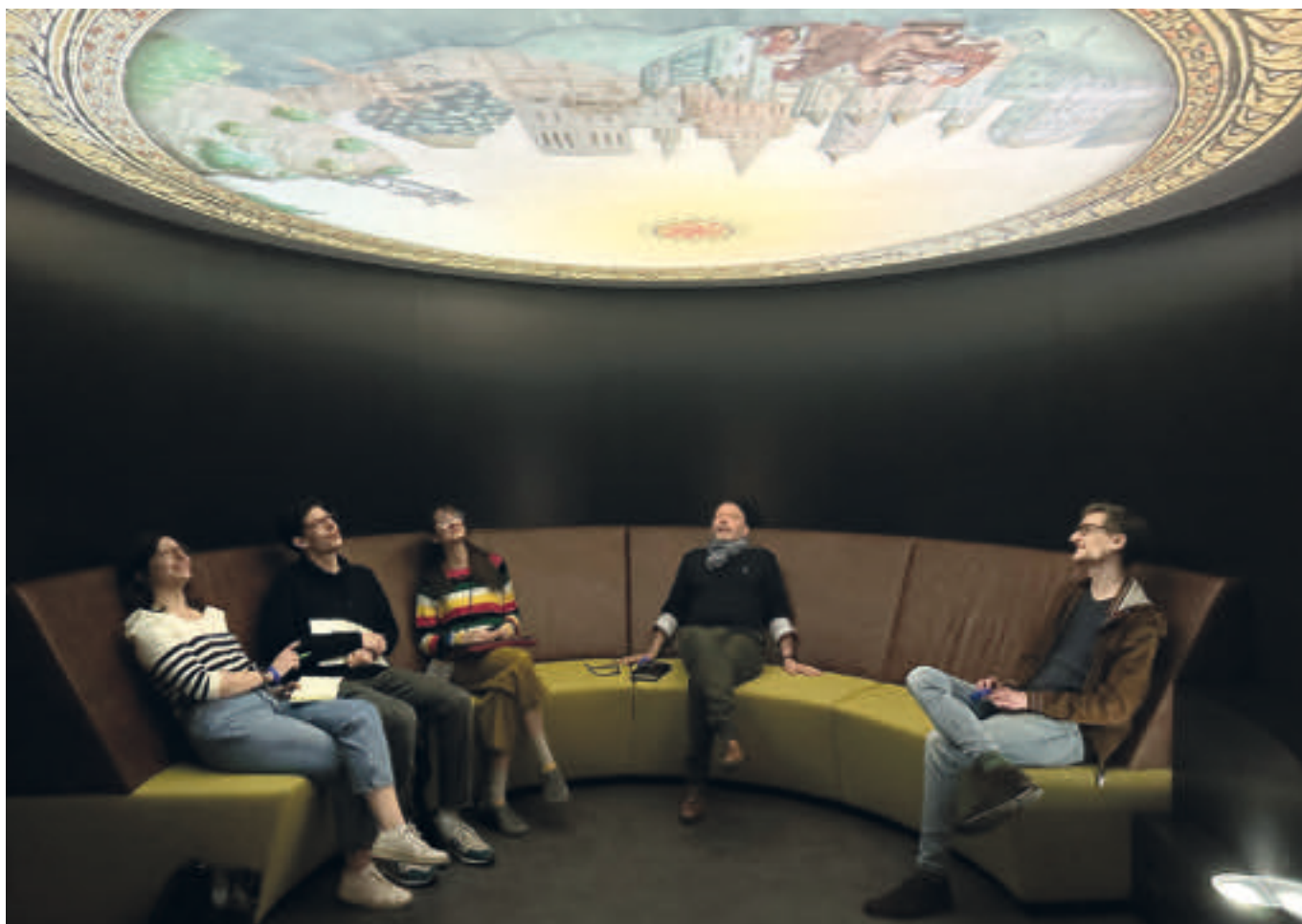
Voyage d'étude à Bruxelles, mai 2023

L'Université de Neuchâtel propose un Master en études muséales certifié par le label ICOM Suisse – Conseil international des musées. Les conditions requises pour obtenir ce label renommé sont que « l'essentiel du cours [ou cursus] de formation muséale est assuré par des enseignants expérimentés dans le domaine muséal. Des professionnels de musée participent à la conception et à la réalisation du cours » 1 . La présentation des missions de l'ICOM et la familiarisation aux principaux enjeux de son Code de déontologie font partie intégrante du cursus proposé aux participant-e-s du Master.