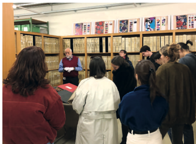
Visite dans les réserves du Musée National Suisse à Affoltern am Albis, novembre 2022.

Ce cours introduira les étudiant-e-s aux missions et espaces qui restent invisibles pour un-e visiteur-teuse de musée. Un collectif d'expert-e-s familiarise les participant-e-s à toutes les facettes du travail quotidien dans un musée comme l'acquisition d'objets, la gestion des collections, le traitement de demandes de prêt, les questions d'assurances, la conservation préventive et la restauration, les aspects techniques (lumière, humidité, socles, cadres, vitrines, etc.), le développement durable au musée, mais aussi la recherche de fonds pour la réalisation de projets. La majorité des cours aura lieu dans des musées à Lausanne, Zurich et dans la Vallée du Joux.