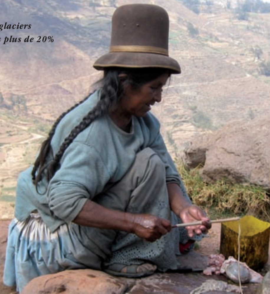
Habitante de Khapi (Bolivie)

“ Depuis 30 ans, les glaciers boliviens ont perdu plus de 20% de leur volume.