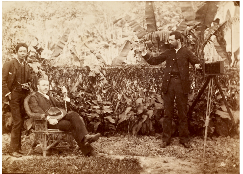
Photo prise à Hanoi en décembre 1887, en compagnie d'un prince siamois.