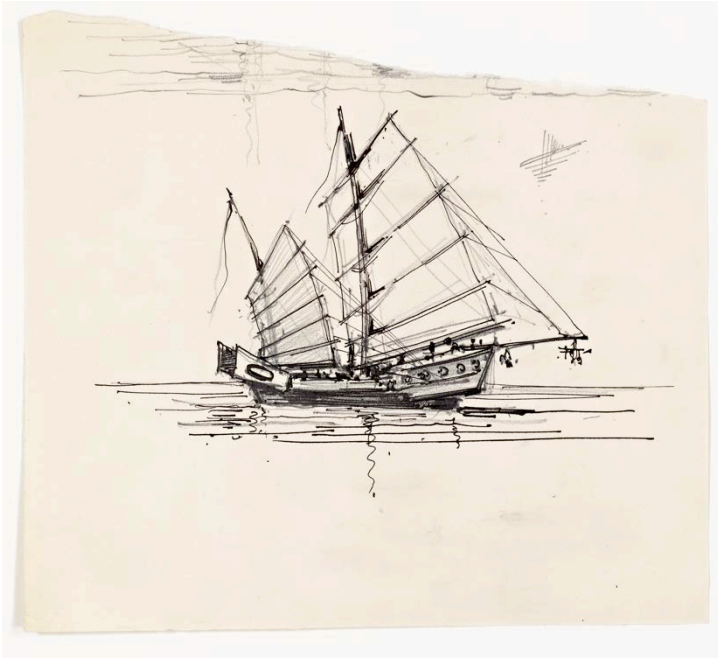
Jonque, dessin encre et crayon (Fonds Henri Etienne)